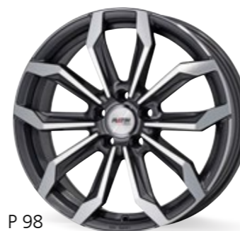
P 98 szary, polerowany 18–19 Cali