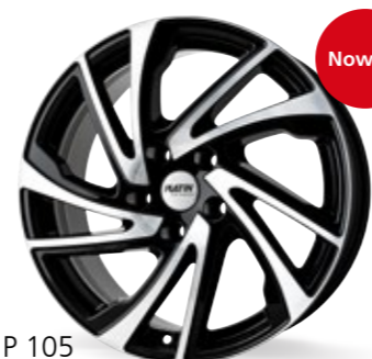
P 105 czarny, polerowany 17 Cali