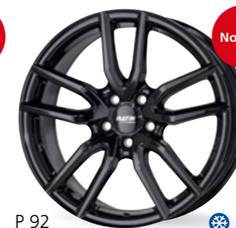
P 92 czarny 16–19 Cali