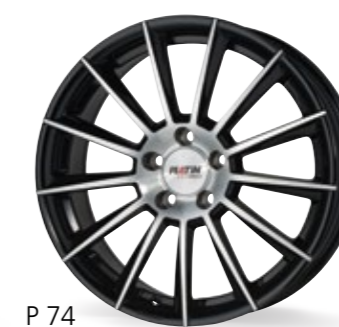
P 74 czarny, polerowany 17–19 Cali