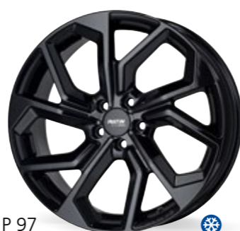
P 97 czarny 16–20 Cali