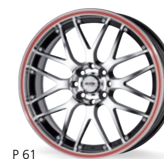
P 61 czarny - polerowany 15–18 Cali z czerwonymi rantami

❄️ Te felgi są odpowiednie do użytkowania zimą