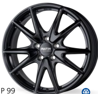
P 99 czarny 18–20 Cali