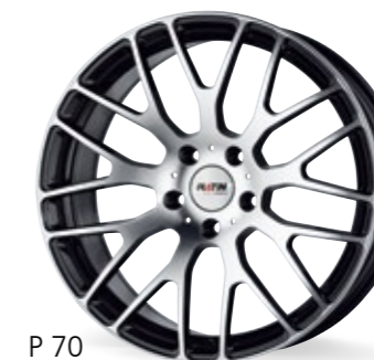
P 70 czarny, polerowany 17–21 Cali