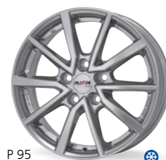
P 95 srebrny 16–17 Cali