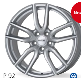
P 92 srebrny polarny 16–19 Cali