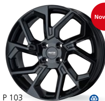
P 103 czarny 17–19 Cali