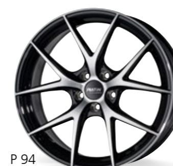
P 94 czarny, polerowany 18–20 Cali