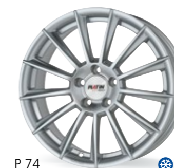
P 74 srebrny 17–19 Cali