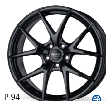
P 94 czarny 18–20 Cali