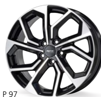
P 97 czarny, polerowany 16–20 Cali