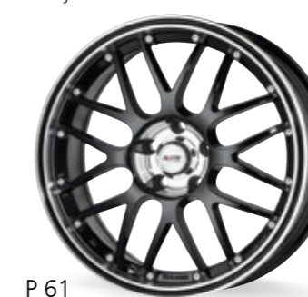
P 61 czarny - polerowanym rantem z czerwonymi rantami 15–18 Cali