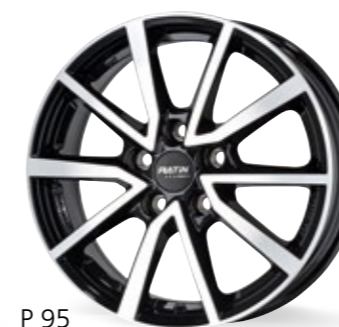
P 95 czarny, polerowany 16–17 Cali