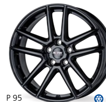
P 95 czarny matowy 15–18 Cali czarny 18–19 Cali