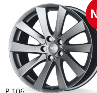
P 106 grey 18-19 Zoll