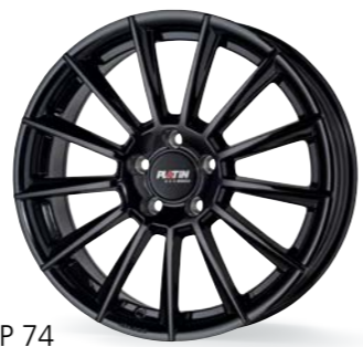
P 74 black shiny 17-19 Zoll