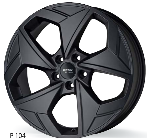
P 104 matt black 19 Zoll

Alle Alufelgen sind durch Mehrschichtlackierungen für den Wintereinsatz geeignet.