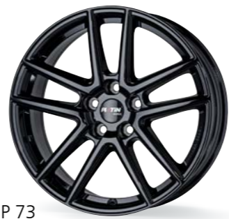
P 73 diamant schwarz 18-19 Zoll