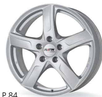
P 84 silber 15-17 Zoll