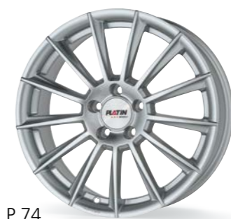
P 74 silber 17-19 Zoll