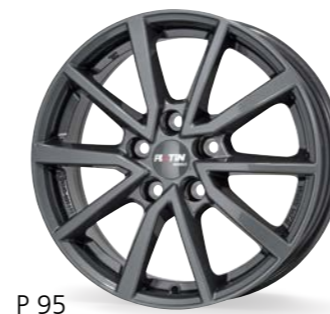
P 95 dark grey 16 Zoll