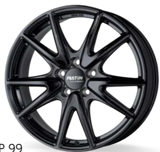
P 99 schwarz glänzend 17-19 Zoll