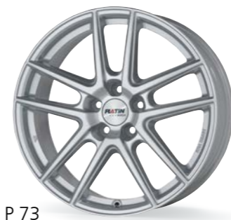
P 73 polarsilber 15-18 Zoll