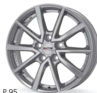
P 95 metall silber 16-17 Zoll