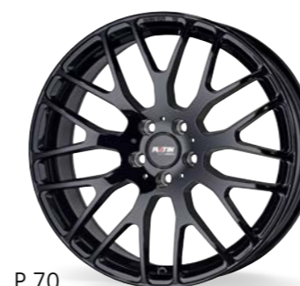
P 70 black shiny 17-21 Zoll