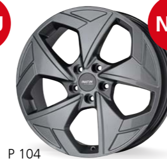
P 104 glossy titanium 19 Zoll