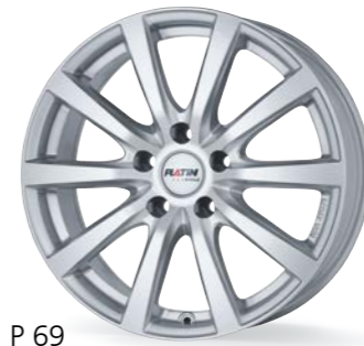
P 69 silber 15-18 Zoll