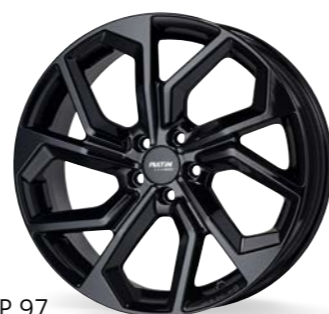
P 97 black glossy 16-20 Zoll