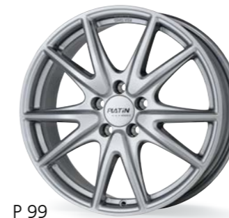
P 99 platinum silber 17-18 Zoll