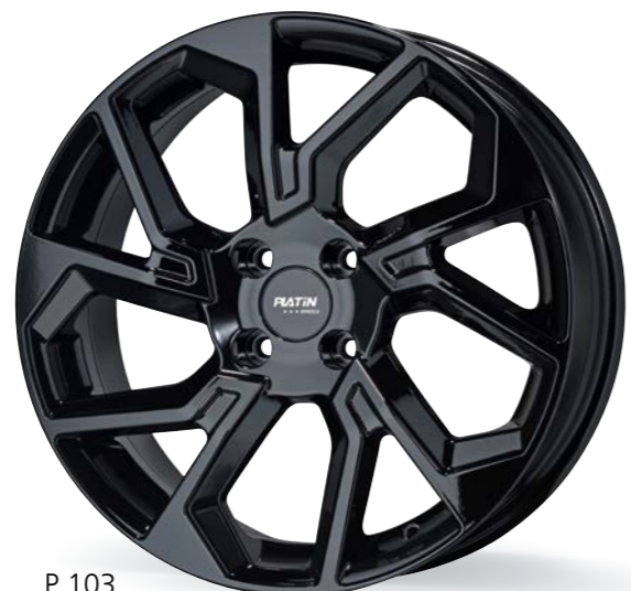
P 103 black glossy 17-18 Zoll