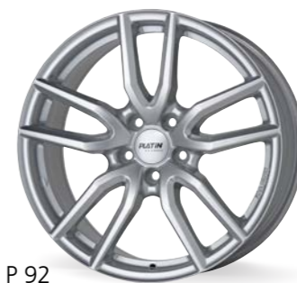
P 92 polarsilber 16-19 Zoll