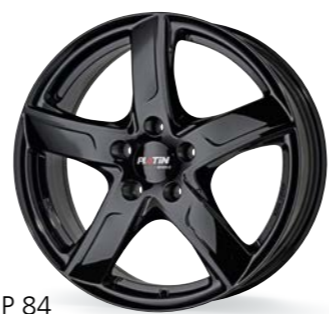
P 84 diamant schwarz 15-17 Zoll