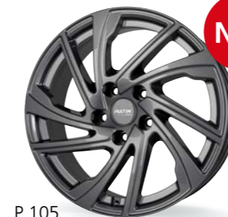
P 105 titanium 17 Zoll