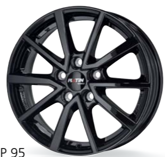
P 95 diamant schwarz 16-17 Zoll